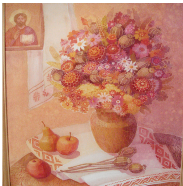
КУБРИШ Н. Р. Маковей (Медовий Спас). Холодний батик

Ректорат, Профспілковий комітет співробітників, Дирекція Архітектурно-художнього інституту, колектив кафедри рисунка, живопису та архітектурної графіки, редакція газети «Кадри – будовам»