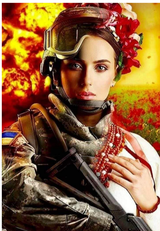
«У війни не жіноче обличчя...» МІЖНАРОДНИЙ ЖІНОЧИЙ ДЕНЬ В УМОВАХ ВІЙНИ

«ЗАВТРА БУЛА ВІЙНА...» 24 лютого 2022 р.