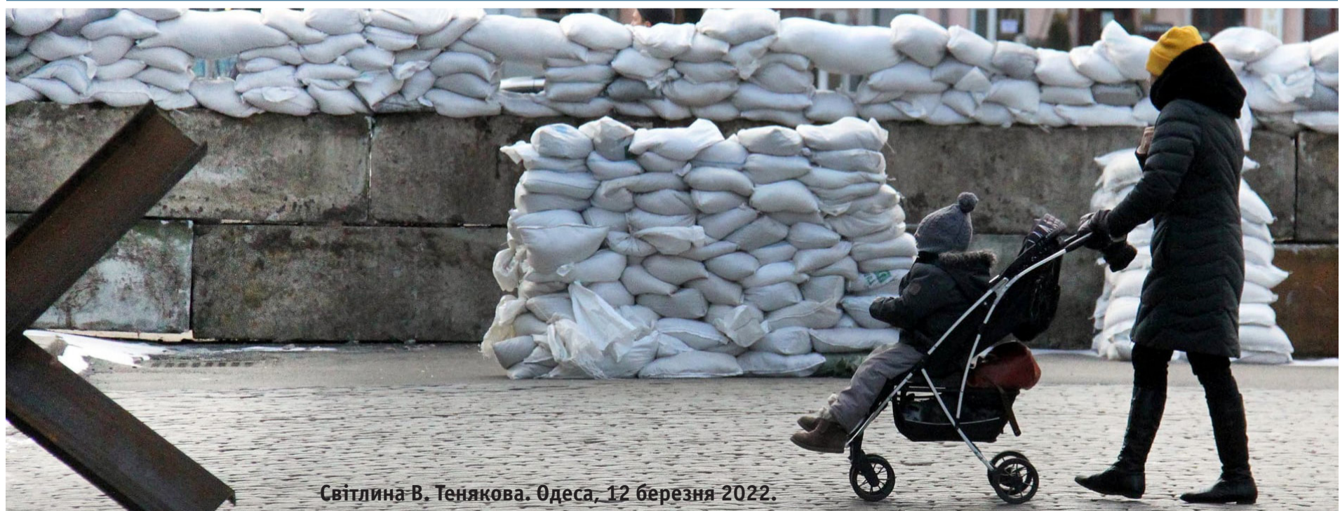
Одеса, 12 березня 2022.