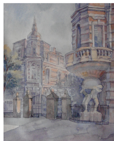
КУБРИШ Н. Р. Атланти. 2018 р. Акварель.