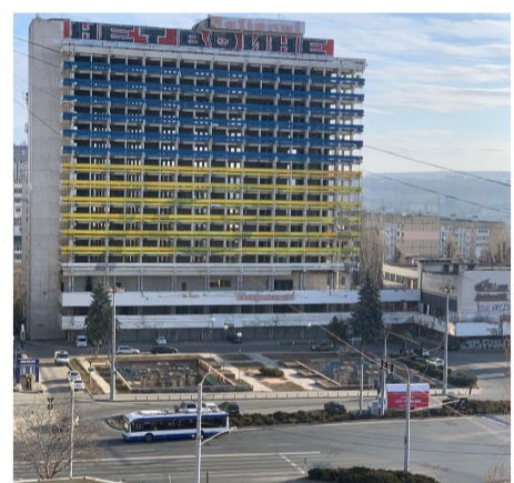
Моральна підтримка наших друзів у Молдові. Будівля в Кишиніві поруч з Академією наук Республіки Молдова розфарбована у кольори прапора України. 27 лютого 2022 р.

Дорогі друзі, колеги, ми з вами, ми також висловлюємо нашу підтримку і бажання допомогти біженцям, які знайшли притулок у нашій країні.