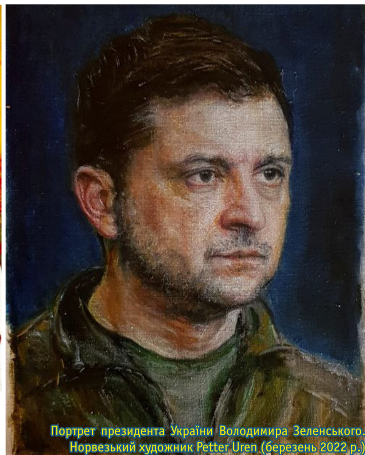
Портрет президента України Володимира Зеленського. Норвезький художник Petter Uren (березень 2022 р.)