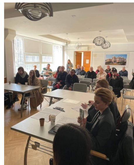
Зацікавлені слухачі і учасники публічного обговорення

та будинки. Наша ціль – підготувати проєкт, як має виглядати наш район у майбутньому. Впевнений,