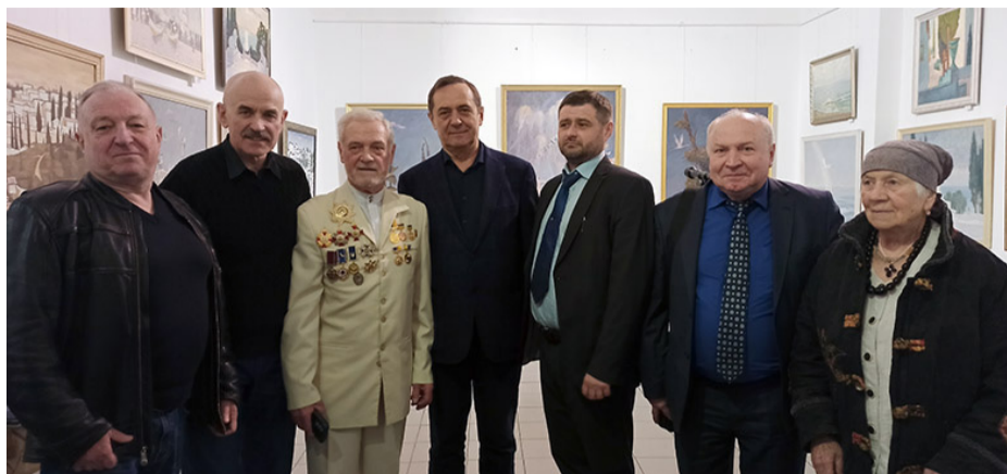
Спільне фото з видатними колегами на добру пам'ять про відкриття виставки в столиці України.

22 березня 2024 р. у виставкових залах Центрального будинку художника Національної спілки художників України (м. Київ, вул. Січових Стрільців, 1-5) відбулося урочисте відкриття ювілейної персональної виставки відомого українського живописця, Народного художника України, професора кафедри образотворчого мистецтва Архітектурно-худож-