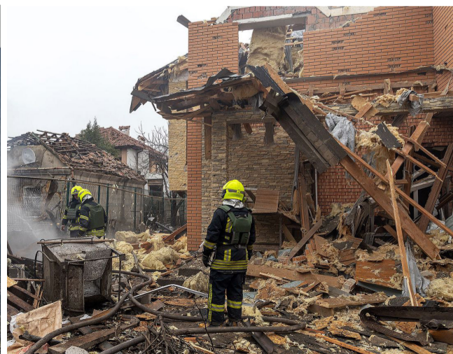
Наслідки ворожого обстрілу