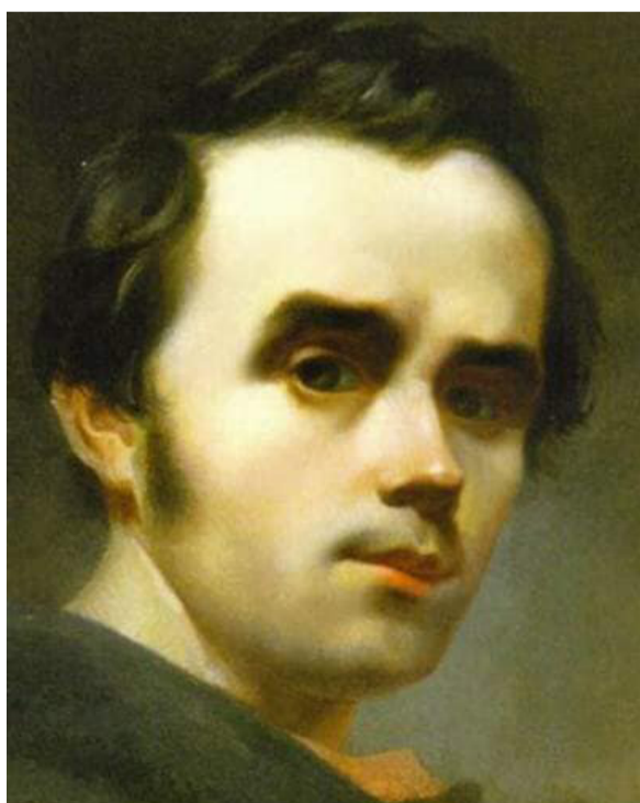
Автопортрет молодого Т. Шевченка