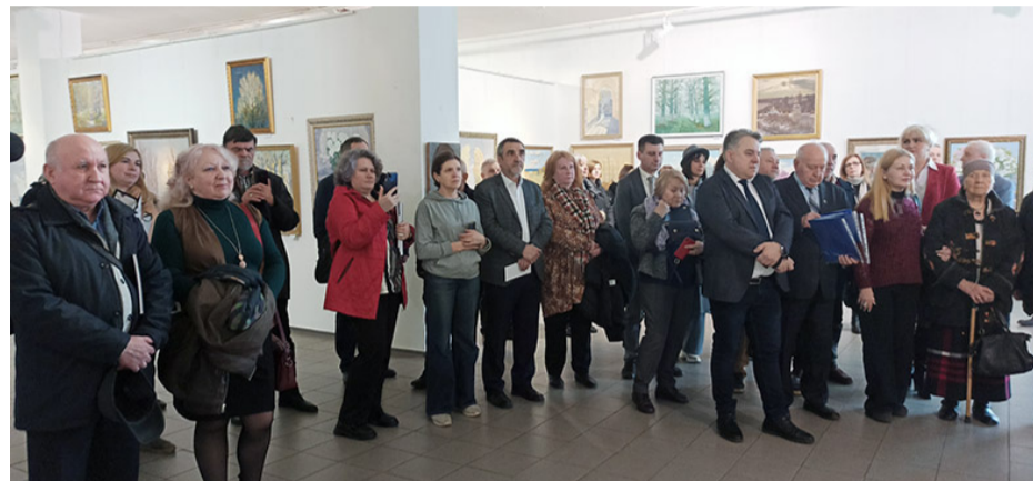
Друзі, колеги, шанувальники таланту митця на урочистому відкритті виставки.

ного інституту Одеської державної академії будівництва та архітектури Анатолія Олександровича Горбенка «Подих моря у співах степу». В нашій