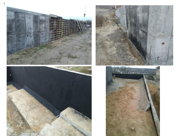
Рис. Фотофрагменти виготовлення підпірної стіни