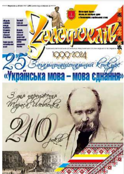
Свіжий номер щорічної газети «Золотослів», присвячений ювілейному XXV Загальнонаціональному форуму-конкурсу «Українська мова - мова єднання»

18 вересня 2024 р. стало відомо, що вийшов з друку свіжий номер щорічної газети «Золотослів», який присвячений ювілейному XXV Загальнонаціональному форуму-конкурсу «Українська мова - мова єднання». Наклад цього видання (1000 примірників) надрукований у типографії ТОВ «Прес корпорейшн лімітед» (м. Вінниця). На 120 сторінках газети розміщені матеріали одеських та українських журналістів про важливі події в Одесі, в Україні та в світі, які відбулись протягом 2023-2024 років. Видання цієї великої газети з кольоро-