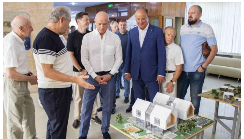
Одеський міський голова Г. Л. Труханов та перший заступник голови Одеської обласної ради О. В. Радковський відвідали Архітектурно-художній інститут.

ри. Викладачі нашої Академії – це справжні майстри своєї справи, які щодня передають свої знання і навички новим поколінням будівельників та архітекторів. Ваш внесок у розвиток будівельної галузі важко переоцінити. Ви не тільки формуєте майбутніх професіоналів, але й робите вагомий внесок у розвиток міста, регіону, країни. Бажаємо вам міцного здоров'я, невичерпного натхнення та успіхів у всіх ваших починаннях! Щиро вітаємо усіх з Днем Будівельника! Нехай ваші проєкти завжди реалізуються на вищому рівні, нехай ваше натхнення ніколи не згасає, а робота приносить лише задоволення та нові досягнення! Ваші зусилля створюють краще майбутнє для всіх нас. Вітаємо вас із професійним святом!