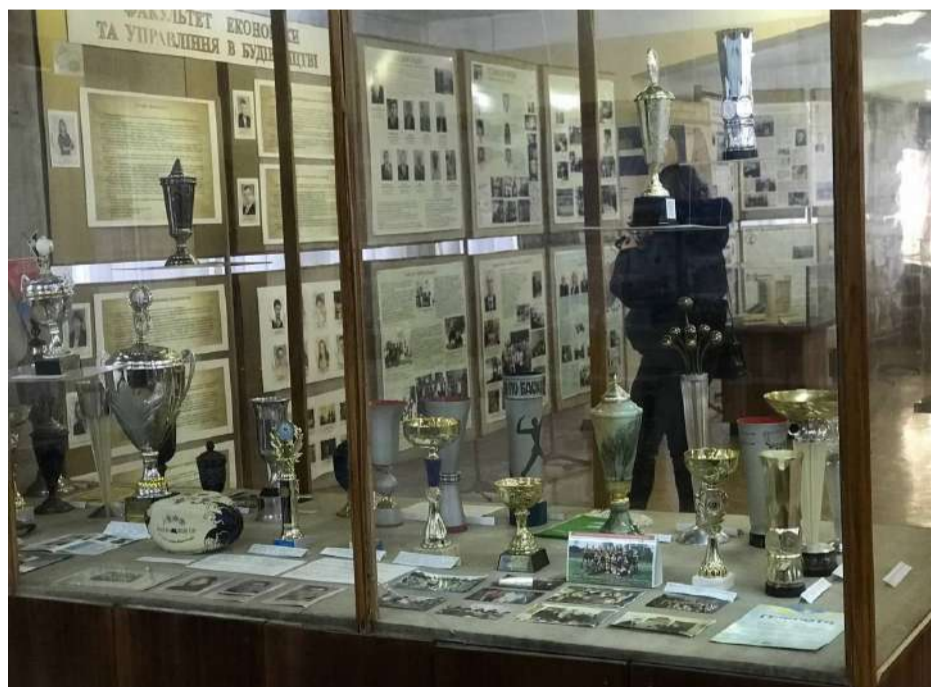
Свідчення спортивної слави в вітрині музею історії Одеської державної академії будівництва та архітектури.

4 роки тому, Законом України № 849-IX від 02.09.2020 р. було внесено зміни до Закону України «Про вищу освіту» № 1556-VII від 01.07.2014 р. Зокрема, цими змінами було передбачено наступне: 1. Музеї можуть бути структурними підрозділами закладу вищої освіти. 2. Директор музею та науковий працівник музею є основними посадами науково педагогічних працівників закладів вищої освіти (з усіма наслідками, що з цього випливають, прим. ред.). Кабінету Міністрів України було доручено в тримісячний строк з дня набрання чинності Законом України № 849-IX від 02.09.2020 р. (з 25.09.2020 р.): 1. Привести свої нормативні правові акти (НПА) у відповідність з цим Законом; 2. Забезпечити приведення Міністерствами та іншими центральними органами виконавчої влади їх нормативних правових актів (НПА) у відповідність із цим Законом. Відтак, тоді у Кабінету Міністрів України було три місяці на те, аби посади директора музею та наукового працівника музею закладів вищої