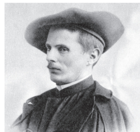
Художник Сергій Васильківський (1854-1917) (Фотопортрет)

19 жовтня 2024 р. виповнилося 170 років від дня народження видатного українського живописця Сергія Івановича Васильківського (7 (19) жовтня 1854 (м. Ізюм) – 8 жовтня 1917 р., (м. Харків) – пейзажиста, автора тематичних картин з історії українського народу, майстра батального жанру. За великі успіхи в навчанні, він був нагороджений Золотою медаллю Академії мистецтв. За своє не надто довге життя митець встиг створити більше 3000 художніх творів. Незадовго до смерті він заповів музею у Харкові більше 1300 своїх картин. На жаль, багато з них були втрачені і загинули у полум'ї Другої світової війни. На сьогодні відомі близько 500 творів Васильківського, які зберігаються в музеях і приватних колекціях. В зібранні Одеського національного художнього музею представлена картина С. Васильківського «Запорожець на варті».