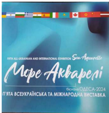
Обкладинка каталогу «Море акварелі» П'ята всеукраїнська та міжнародна виставка-бієнале. Одеса-2024: каталог. Дрогобич: Коло, 2024. – 148 с., іл.

19 вересня 2024 р. в приміщенні Одеського обласного центру української культури відбулася презентація каталогу П'ятої Всеукраїнської та Міжнародної виставки-бієнале «Море акварелі». Видання представив Народний художник України Анатолій Кравченко. Учасниками виставки стали представники 23 країн світу (Аргентини, Болгарії, Греції, Індії, Іспанії, Італії, Казахстану, Канади, Киргизстану, Китаю, Латвії, Литви, Македонії, Мексики, Німеччини, Польщі, Словаччини, США, Туреччини, Узбекистану, України, Фінляндії, Франції). В каталозі представлені твори 260 художників-акварелістів. Серед них 8 – співробітники Одеської державної академії будівництва