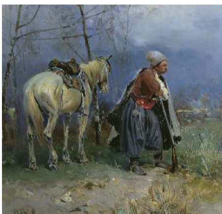
Васильківський С. І. «Запорожець на варті».

19 жовтня 2024 р. виповнилося 170 років від дня народження видатного українського живописця Сергія Івановича Васильківського (7 (19) жовтня 1854 (м. Ізюм) – 8 жовтня 1917 р., (м. Харків) – пейзажиста, автора тематичних картин з історії українського народу, майстра батального жанру. За великі успіхи в навчанні, він був нагороджений Золотою медаллю Академії мистецтв. За своє не надто довге життя митець встиг створити більше 3000 художніх творів. Незадовго до смерті він заповів музею у Харкові більше 1300 своїх картин. На жаль, багато з них були втрачені і загинули у полум'ї Другої світової війни. На сьогодні відомі близько 500 творів Васильківського, які зберігаються в музеях і приватних колекціях. В зібранні Одеського національного художнього музею представлена картина С. Васильківського «Запорожець на варті».