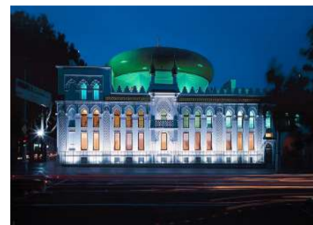
Арабський культурний центр в Одесі.