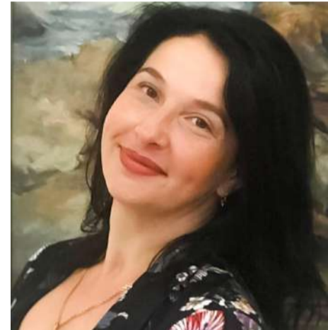
Заслужений художник України Тетяна Бродецька.