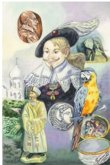
Письмак Ю. «Кавалер ордена Золотого руна, каменя Рішельє та інші» Папір, акварель.

(Busan International Art Festival – BIAF-2024). У виставці взяли участь художники з 70 країн світу. На цій виставці експонувалися художні твори чотирьох авторів з України, які вже добре відомі південнокорейським глядачам – поціновувачам мистецтва. Слід підкреслити, що усі вони – одеські митці: Заслужений художник України