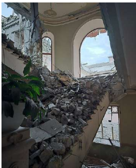
Наслідки ворожого удару. Готель «Бристоль».

Пошкоджені зазнали 26 будівель, які знаходяться в зоні охорони ЮНЕСКО, серед яких — готель «Бристоль», Музей західного і східного мистецтва, Історико-краєзнавчий музей, Музей