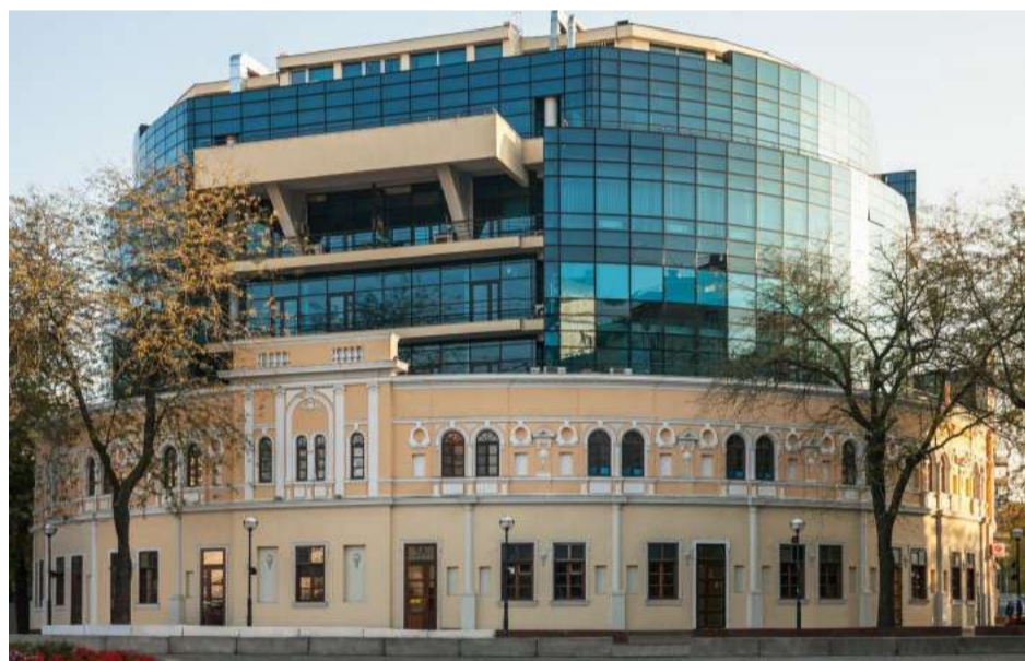
Сучасна будівля ТЦ «Афіна» на Грецькій площі в історичному середмісті Одеси.

Щиро вітаємо Вас з особливим Днем народження! Ми високо цінуємо Ваш вагомий внесок у розвиток архітектури і містобудування Одеси, Півдня України і вдячні Вам за Вашу багаторічну науково-педагогічну діяльність в нашій Академії. Бажаємо Вам і Вашим близьким усього найкращого: здоров'я, довголіття, добробуту і омріяного миру.