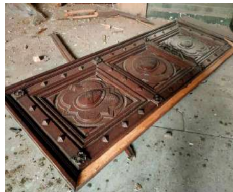
Зірвані двері Одеської філармонії.

«Я впевнений, що наші союзники та партнери підтримають рішення щодо введення додаткових санкцій проти кожного, хто завдає шкоди нашій культурній спадщині. Ворог має заплатити не лише за життя українських громадян, а і за все, що зруйнував».