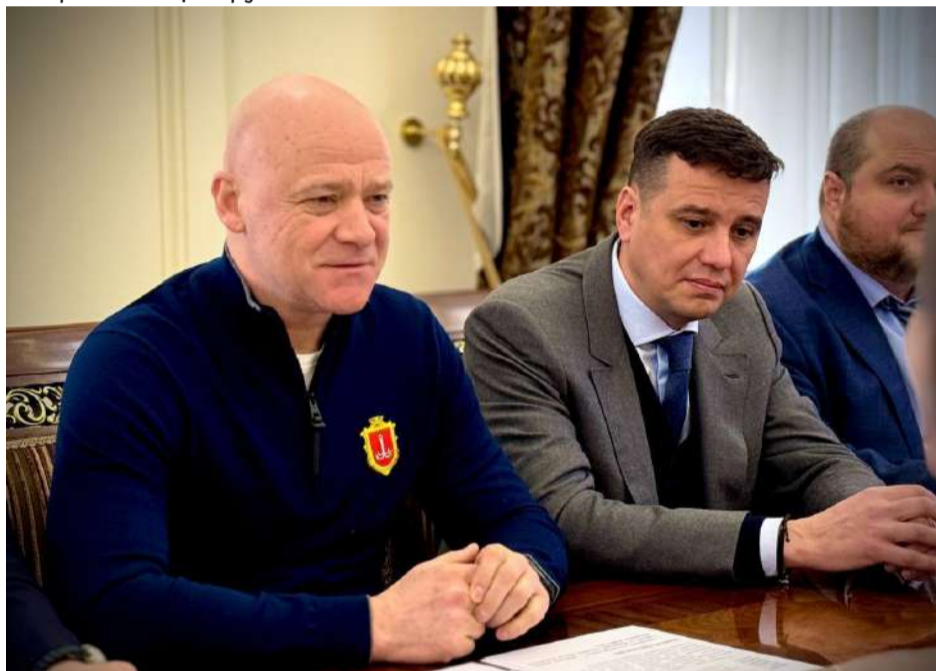
Одеський міський голова Геннадій Труханов вітає поважних представників спільної місії Центру Всесвітньої Спадщини ЮНЕСКО та ICOMOS.