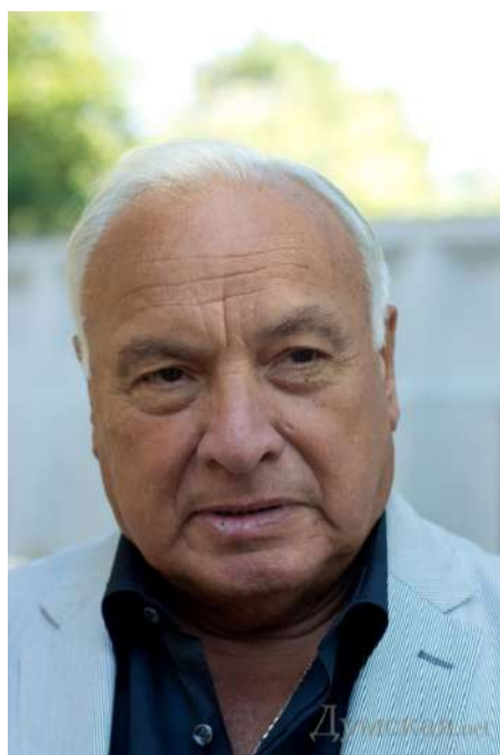
Народний архітектор України Володимир Львович ГЛАЗИРІН.

роботу Управління архітектури та містобудування ОМР, особливо – проведення засідань містобудівної ради, організацію конкурсів на проектування та будівництво відповідальних об'єктів і ансамблів. Окрім сумлінного виконання службових обов'язків, брав участь у творчих конкурсах. Переможець конкурсу на пам'ятник міліціонерам, що загинули при виконанні службових обов'язків, на про-