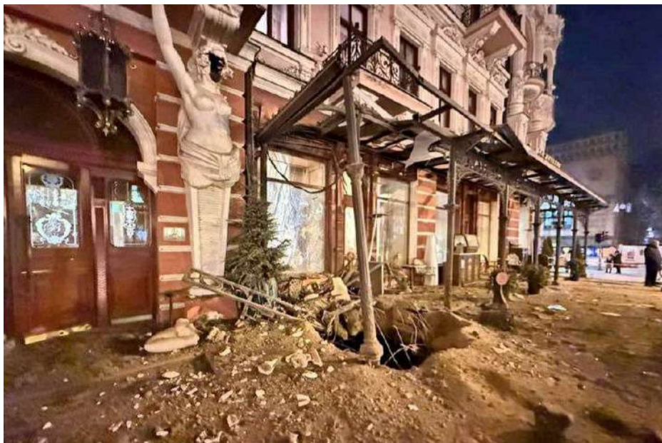
Вирва біля входу до готелю «Бристоль» 31.01.2025 р.