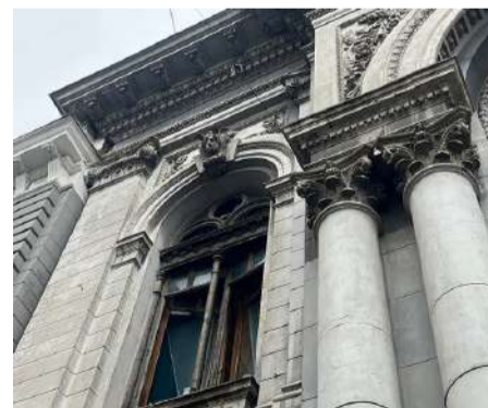
Пошкодження вікна будівлі, в якій розташована Одеська обласна організація Національної спілки архітекторів України.