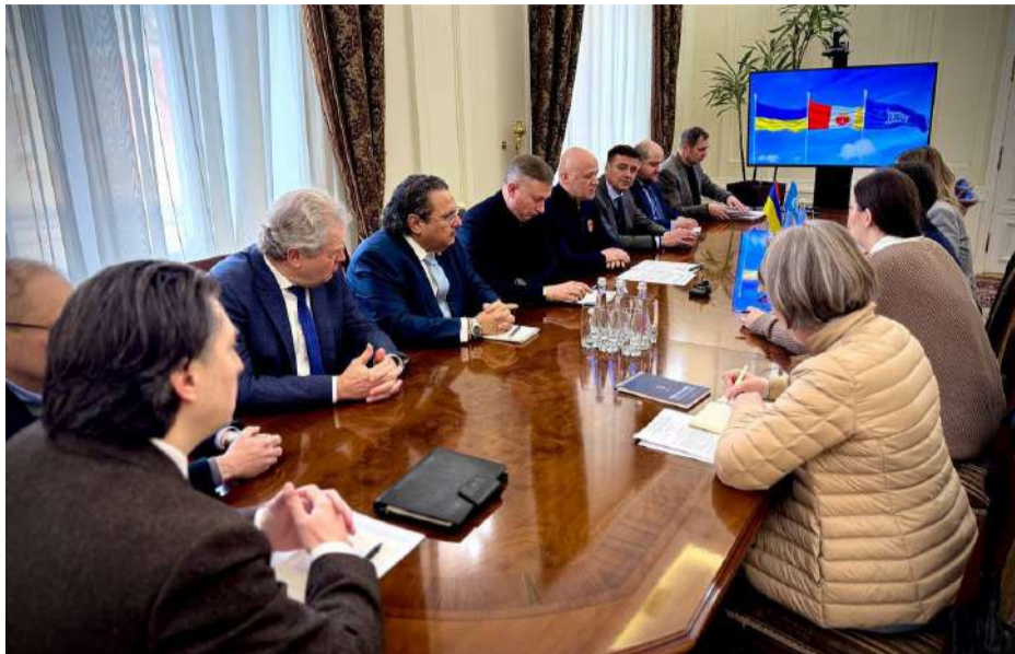
Учасники зустрічі в Одеській міській раді.

«Рада нарешті зустрітися з Вами у Вашому місті! Наша місія полягає у зборі інформації та проведенні консультацій задля узгодження наступних кроків для створення рамкових рішень та рекомендацій щодо збереження атрибутів об'єкту Всесвітньої культурної спадщини від усіх типів загроз» - привітала мера Одеси пані Берта де Санкрістобаль – керівниця відділу Європи та Північної Америки Центру Всесвітньої