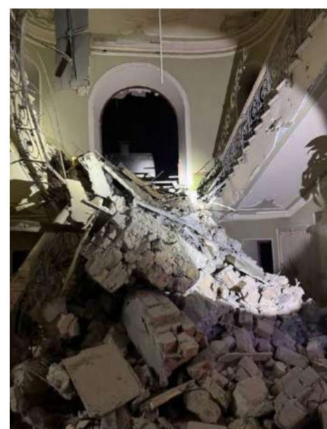
Руйнації в будівлі готелю «Бристоль».

Очільник Міністерства культури та стратегічних комунікацій