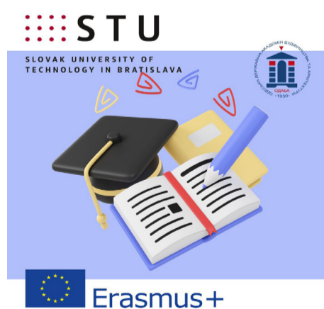
Емблема програми співпраці між ОДАБА та STU (Erasmus+)

Триває співпраця ОДАБА та Словацького технологічного університету (м. Братислава) за програмою ЄС Erasmus+. Наразі 5 студентів нашої Академії навчаються по програмі академічної