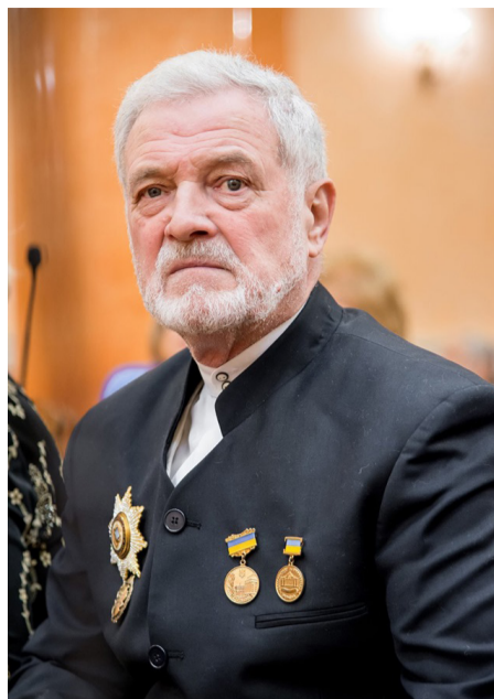
Професор А. О. ГОРБЕНКО.

Професор А. О. Горбенко – видатний український художник. Його творчій доробок здобув визнання у суспільстві, серед колег і мистецтвознавців. Про це свідчать його численні нагороди, серед яких: почесне звання «Народний художник України» (2011), орден «За заслуги» (III ст.)