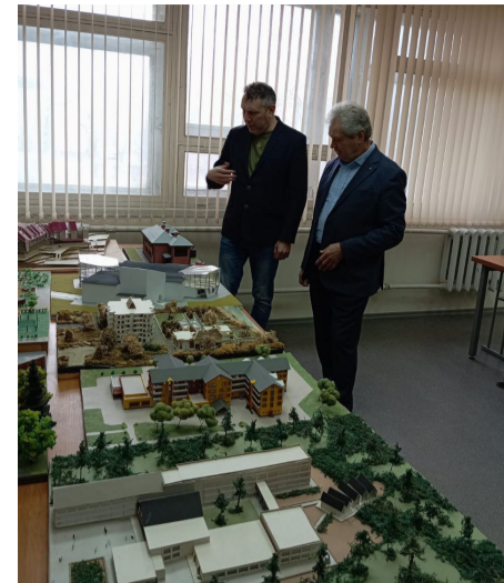
Макетна майстерня Архітектурно-художнього інституту – гордість нашої Академії.