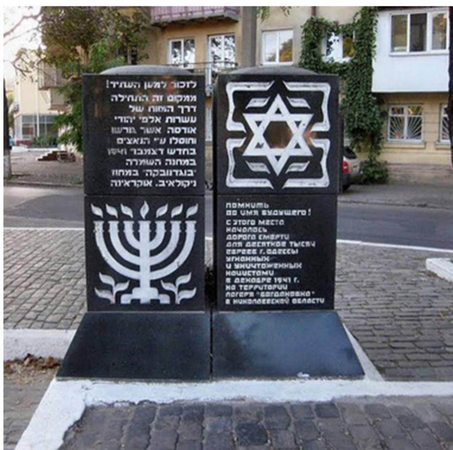
Меморіал жертвам Голокосту в Одесі.

Щомісячне видання. Розповсюджується безкоштовно. Адреса редакції: 65029, м. Одеса, вул. Дідріхсона, 4, приміщення редакційно-видавничого відділу. Тел.: (048) 729-85-34, 9-534. Матеріали для розміщення в газеті надсилайте на ел. адресу: rio@ogasa.org.ua