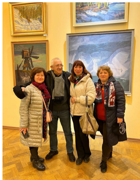
Викладачі кафедри рисунка, живопису та архітектурної графіки АХІ ОДАБА на відкритті персональної виставки професора А. О. Горбенка.

тям виставки. Представники влади, відомі мистецтвознавці, меценати, друзі і колеги висловлювали свою вдячність художнику за його вагомий внесок в створення мистецької спадщини Одещини, України і Світу. Квіти на полотнах майстра цього дня були поряд з численними букетами, якими його обдарували. Щиро привітав ювіляра ректор Одеської державної академії будівництва та архітектури, професор Анатолій Володимирович Ковров. В своїй вітальній промові він підкреслив, що колектив нашого закладу вищої освіти пишається тим, що в ньому викладає такий видатний художник і педагог. Важко не погодитися з тим, що студентам,