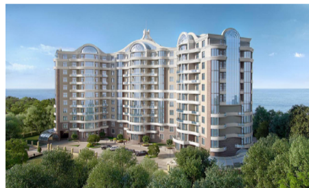
Французький бульвар, 29 ЖК ЗАРС. арх. Базан М. К.