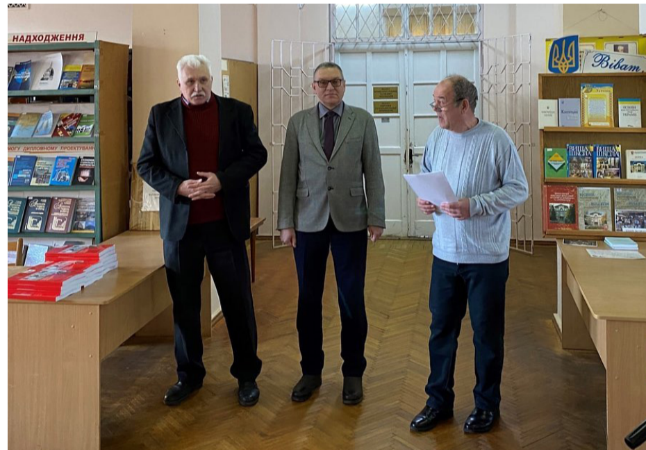
Промова про важливість міжнародної співпраці