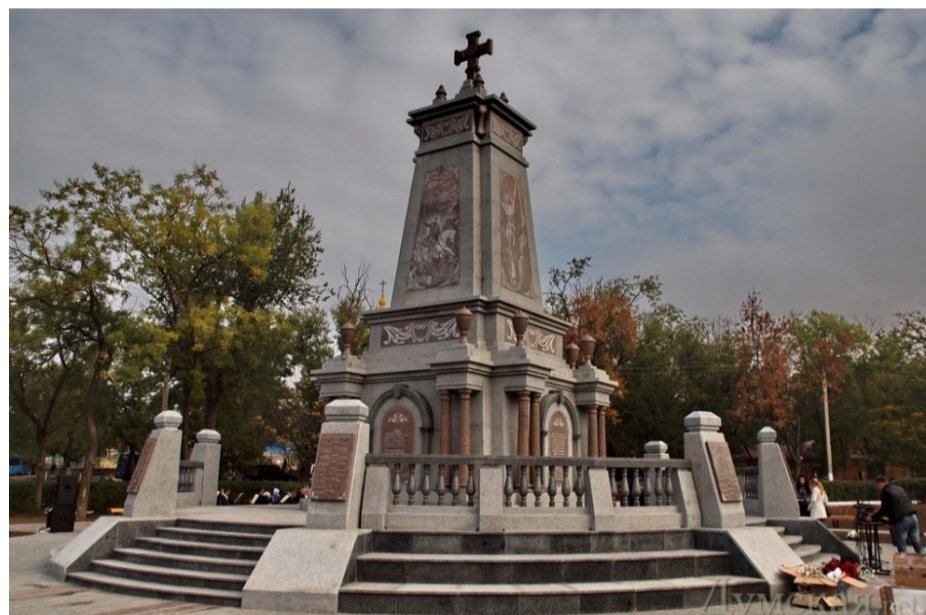
Монумент болгарським ополченцям (м. Болград), арх. М. К. Базан

У 1985 р. М. К. Базан був прийнятий до лав Співки архітекторів. 1993-