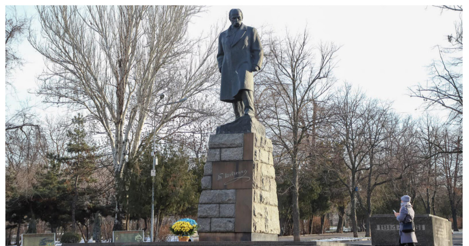
Пам'ятник Т. Шевченку (м. Одеса)