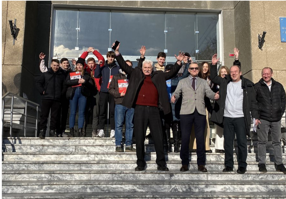
Дякуємо за співпрацю і підтримку!

Ось і зараз концерн передав кафедрі Теплогазопостачання та вентиляції 20 книг щодо новітніх розробок з гідравліки систем опалення.