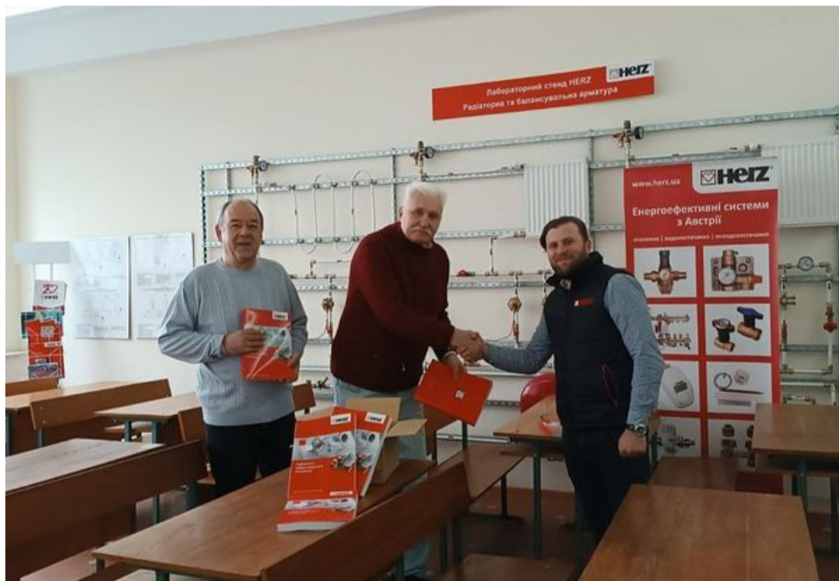
Плідна співпраця триває