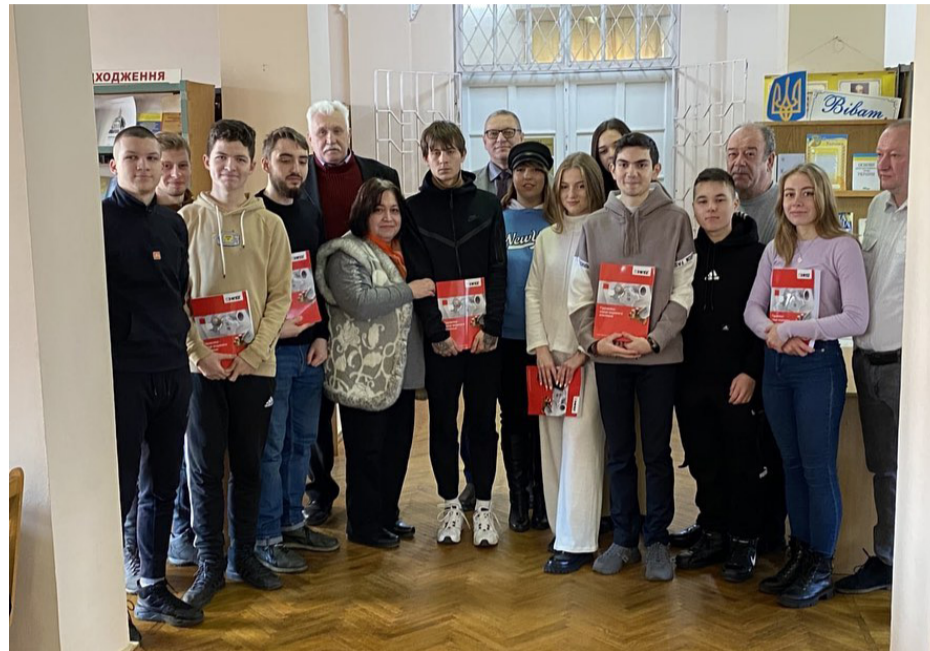
Нові книги будуть дуже корисними при підготовці фахівців