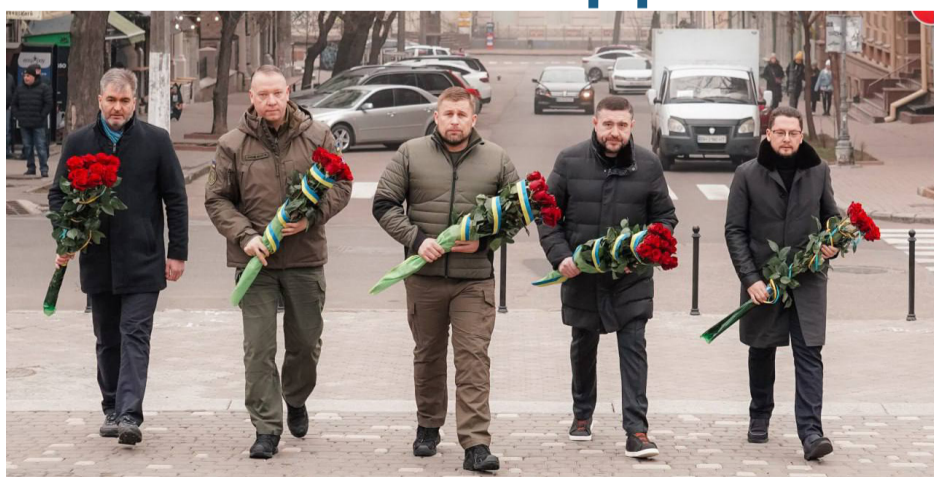
Керівники Одеської області, району і міста Одеси готуються покласти квіти до пам'ятника Т. Шевченку. 22.01.2023