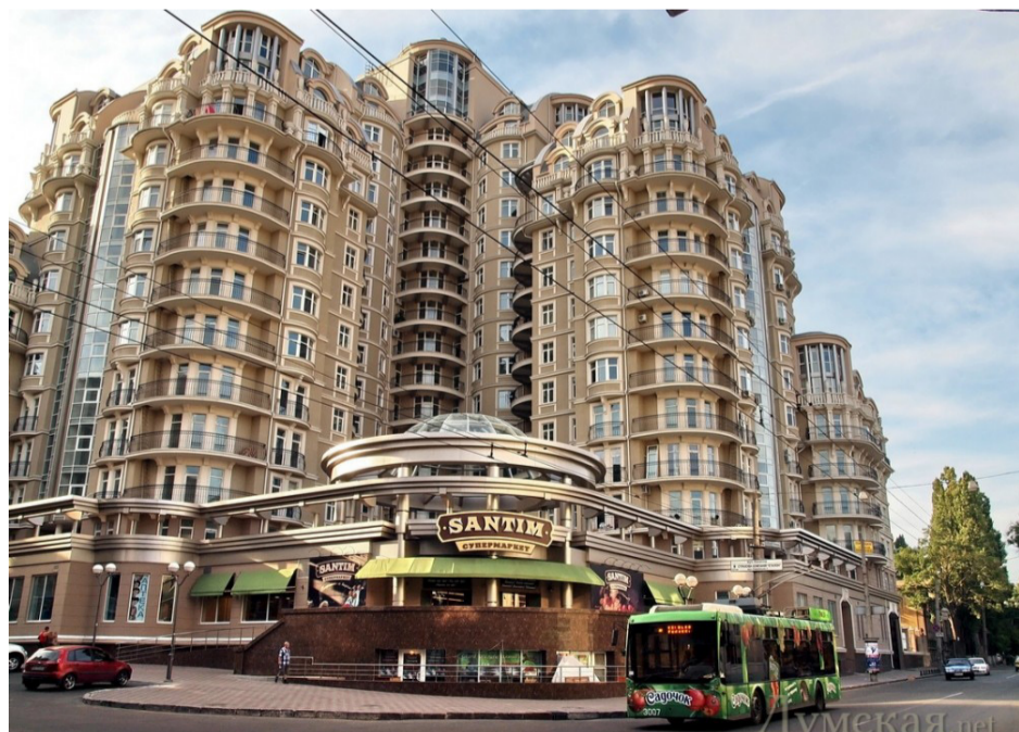
ЖК Сабанський (Одеса)

Ректорат, колектив Академії, Одеська обласна організація Національної Співки архітекторів України, Одеська обласна організація Українського товариства охорони пам'яток історії та культури, редакція газети «Кадри – будовам»