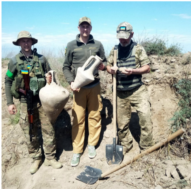
Бійці Тероборони Одещини зі своїми античними знахідками. Травень 2022 р.

Під час проведення фортифікаційних робіт під Одесою, бійцями одного з підрозділів 126 бригади Тероборони Одещини були знайдені античні амфори V-IV століття до Р.Х. Цінні знахідки передані командуванням до Одеського національного археологічного музею і увійдуть до його зібрання.