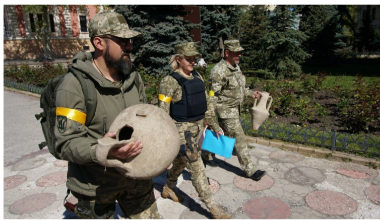
Захисники рідної землі несуть до Музею знайдені в ній стародавні амфори

Під час проведення фортифікаційних робіт під Одесою, бійцями одного з підрозділів 126 бригади Тероборони Одещини були знайдені античні амфори V-IV століття до Р.Х. Цінні знахідки передані командуванням до Одеського національного археологічного музею і увійдуть до його зібрання.