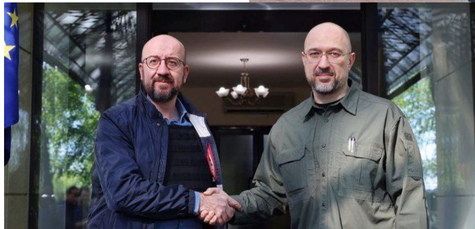
Голова Європейської Ради Шарль Мішель і Прем'єр-міністр України Денис Шмигаль в Одесі

Мер Одеси Геннадій Труханов вітає пана Шарля Мішеля зазіхають на нашу землю, вони намагаються зруйнувати світові підвалини демократії. І для нашої країни дуже важлива підтримка Європейської Ради».