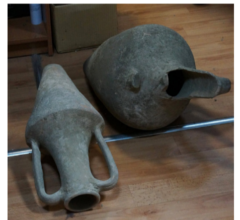
Античні амфори поповнили колекцію Одеського національного археологічного музею.