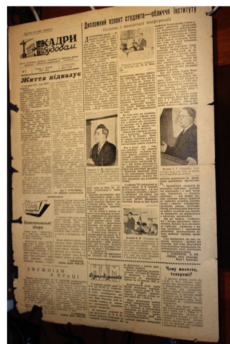
Газета "Кадри - будовам" 1961 р.