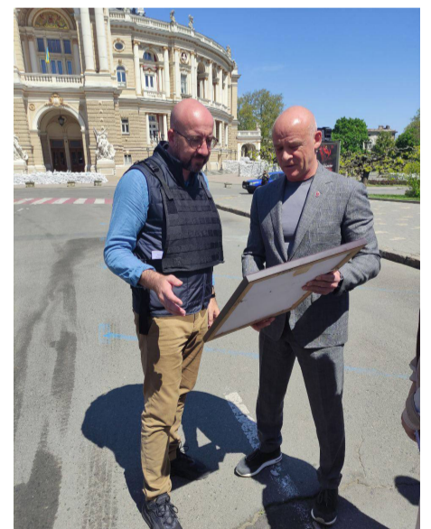
Вручення символічного подарунку.

гацію Акціонерного товариства електричного господарства міста Одеси, яке було засноване в Брюсселі (Бельгія) у 1909 році. Слід нагадати, що сам пан Шарль Мішель є уродженцем Бельгії та экс-Прем'єр-міністром цієї країни