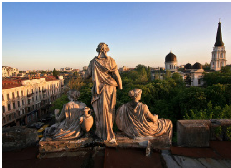
Скульптурная композиция, венчающая дом Либмана, Одесса

ставрировать, а не губить, была пронизана такой болью, что казалось – ещё немного, и сердце его не выдержит. Когда Александр Борисович умолк, раздался шквал аплодисментов. Аплодировали студенты – будущие архитекторы... Футуристическим экспериментам гостей с Пиренейского полуострова и их отечественных заказчиков не было суждено осуществиться... Однако, замечательное творение Л. Влодека было впоследствии реконструировано и увенчано массивной