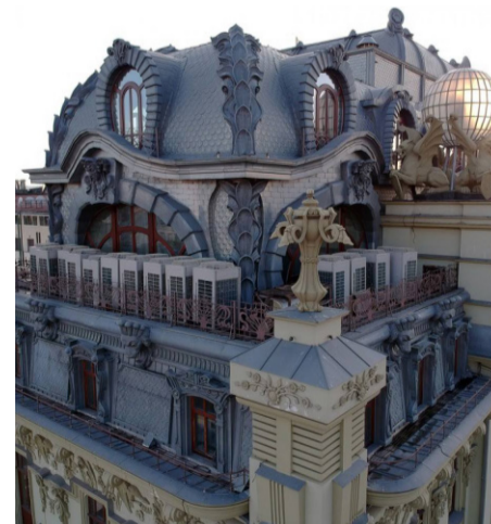
Многоступенчатая надстройка-мансарда, искажившая облик ценного памятника архитектуры

не сможет возвысить свой голос в защиту того, что ещё не разрушено и не исковеркано. Но остаётся надежда, что зёрна любви к прекрасному, которые он так щедро передавал своим ученикам, прорастут в их душах и они, в свою