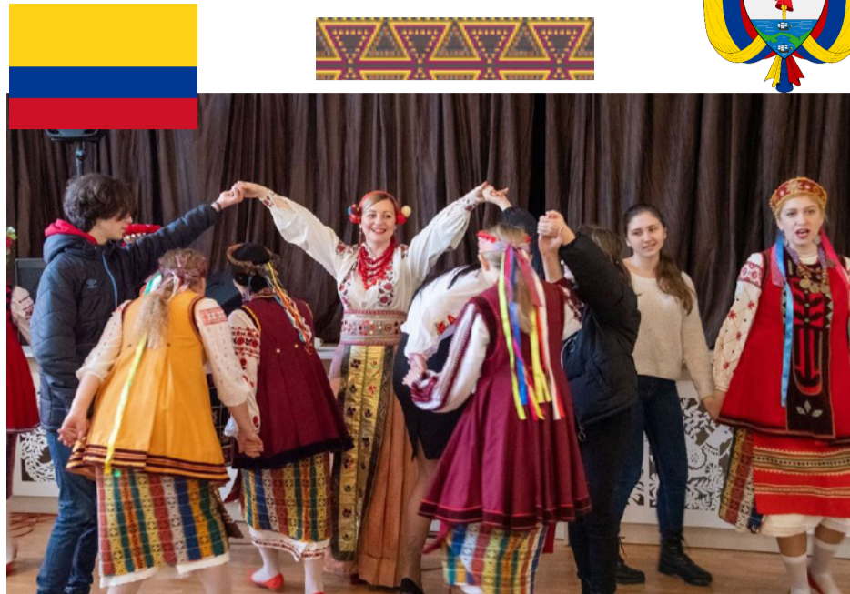
Незгасаюче сяйво народної культури

Національна програма охорони традиційних ремесел, ініційована Міністерством культури Колумбії є