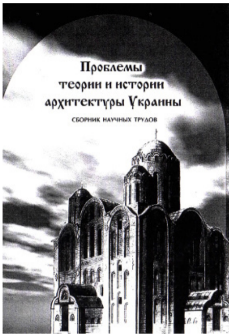
Первый выпуск сборника научных трудов "Проблемы теории и истории архитектуры Украины", увидевший свет в 1999 г.