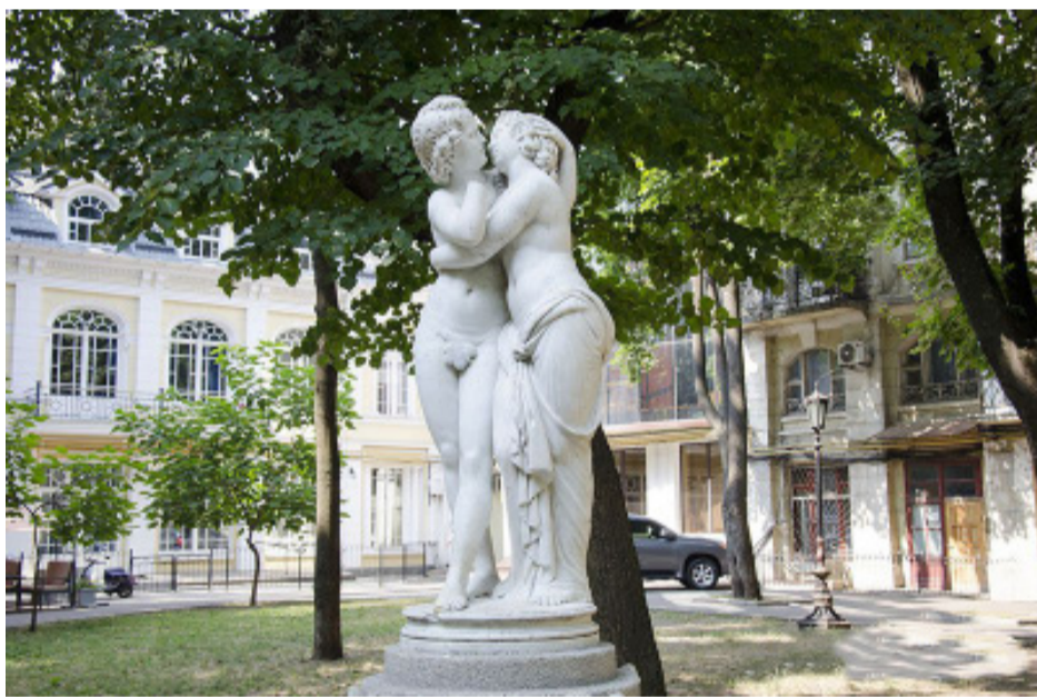
Скульптурная группа "Амур и Психея", сквер Пале-Рояль, Одесса