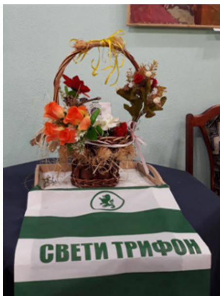
Фрагмент інтер'єру, ВЦБК