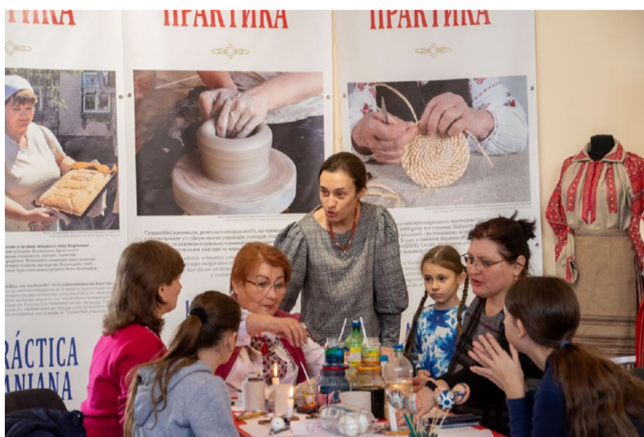
Майстер-клас з писанкарства проходив у рамках міжнародної виставки

однією з опор політики з охорони нематеріальної культурної спадщини Колумбії та усїєї Латинської Америки. В її серцевину покладена стратегія «Культурний інструментарій миру».