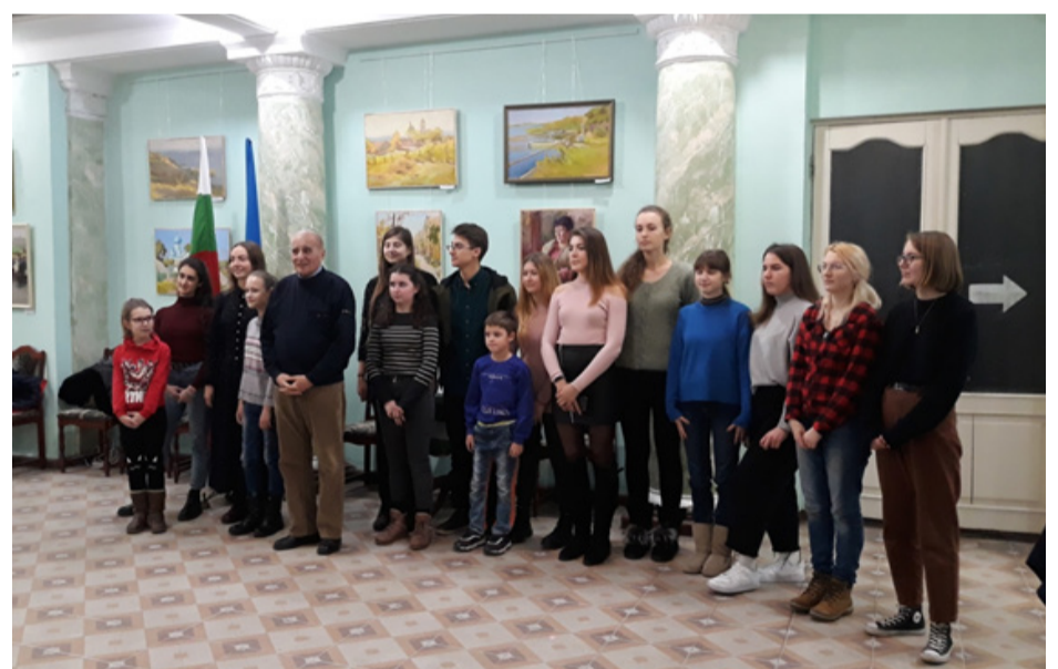
На відкритті виставки директор ВЦБК Терзі Д.Ф., викладачі, студенти, учні.