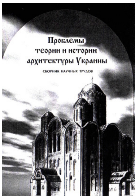
Первый выпуск сборника научных трудов "Проблемы теории и истории архитектуры Украины", увидевший свет в 1999 г.