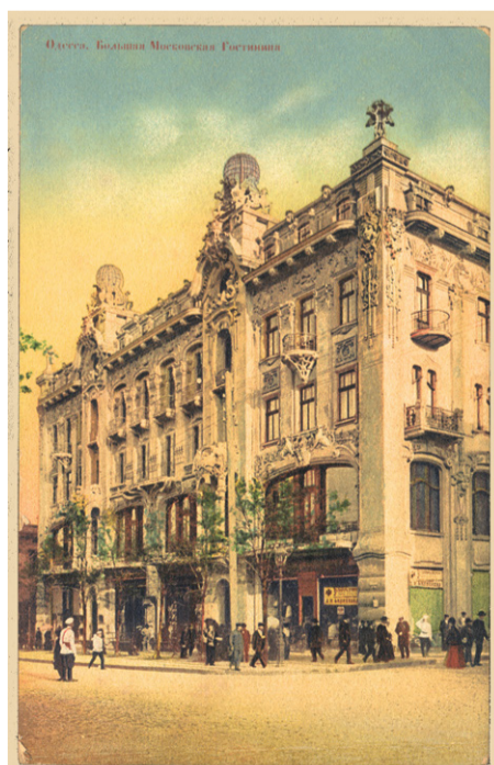
Гостиница "Большая Московская", ул. Дерибасовская, фото нач. XX в.

специально приехавшими в Alma Mater для того, чтобы присутствовать на лекции-презентации названного западноевропейского специалиста. Тема лекции была заявлена следующая: «Традиции и современность в архитектуре и градостроительстве». Фактически же выступление испанца стало пропагандой «смелого эксперимента» с ценнейшими объектами культурного наследия Одессы. Когда дело дошло до обсуждения предлагавшегося проекта и легших в его основу идей, слово попросил профессор Раллев. Его глубоко аргументированная речь, направленная против посягательств на памятники, которые следует всемерно оберегать и ре-