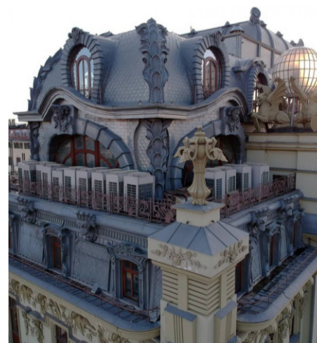
Многоступенчатая надстройка-мансарда, искажившая облик ценного памятника архитектуры

не сможет возвысить свой голос в защиту того, что ещё не разрушено и не исковеркано. Но остаётся надежда, что зёрна любви к прекрасному, которые он так щедро передавал своим ученикам, прорастут в их душах и они, в свою