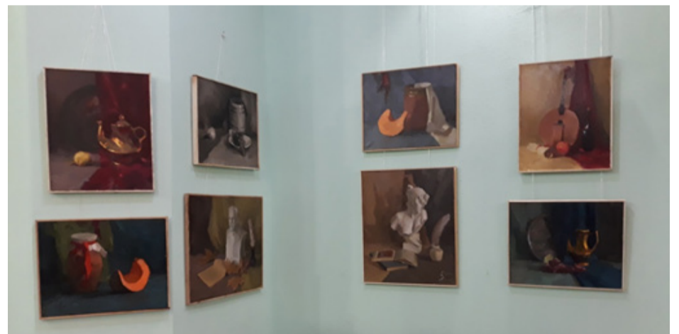
Експозиція виставки.