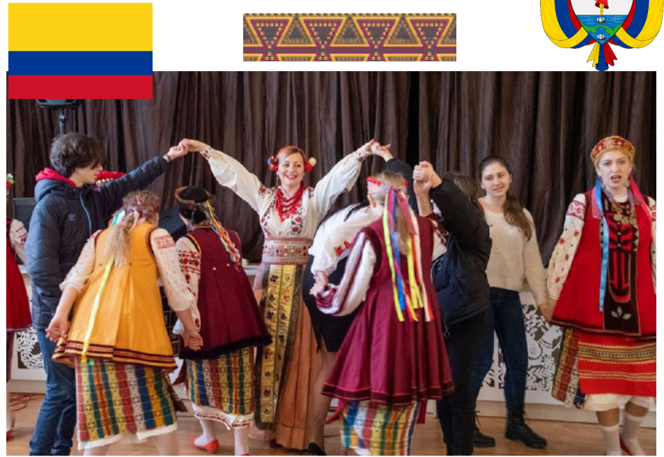
Незгасаюче сяйво народної культури

Національна програма охорони традиційних ремесел, ініційована Міністерством культури Колумбії є