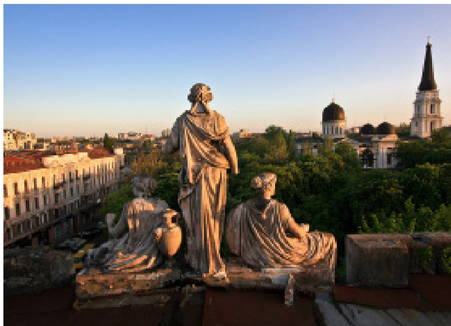
Скульптурная композиция, венчающая дом Либмана, Одесса

ставрировать, а не губить, была пронизана такой болью, что казалось – ещё немного, и сердце его не выдержит. Когда Александр Борисович умолк, раздался шквал аплодисментов. Аплодировали студенты – будущие архитекторы... Футуристическим экспериментам гостей с Пиренейского полуострова и их отечественных заказчиков не было суждено осуществиться... Однако, замечательное творение Л. Влодека было впоследствии реконструировано и увенчано массивной