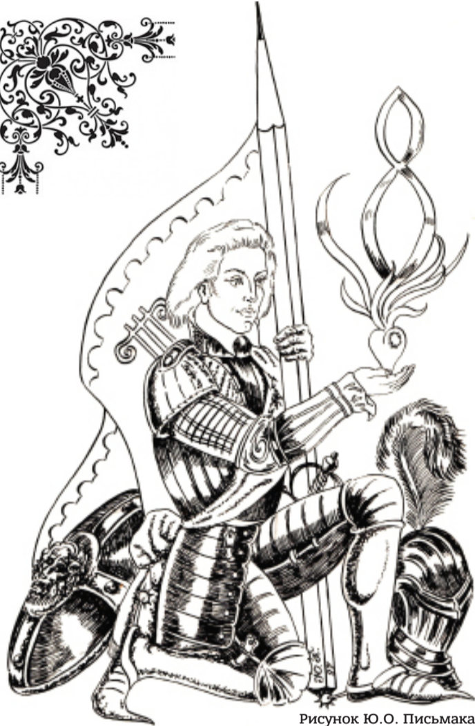
Рисунок Ю.О. Письмака