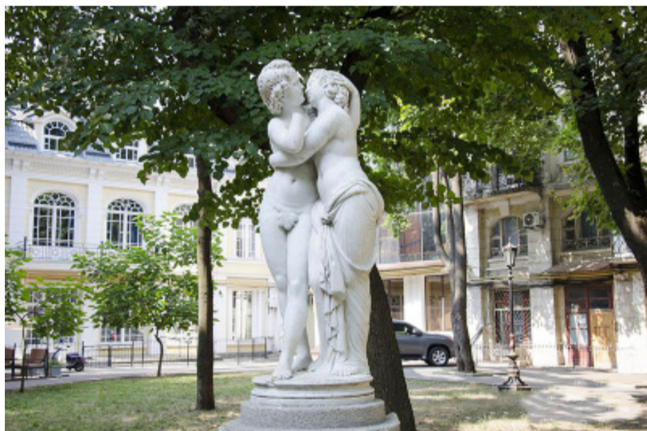
Скульптурная группа "Амур и Психея", сквер Пале-Рояль, Одесса