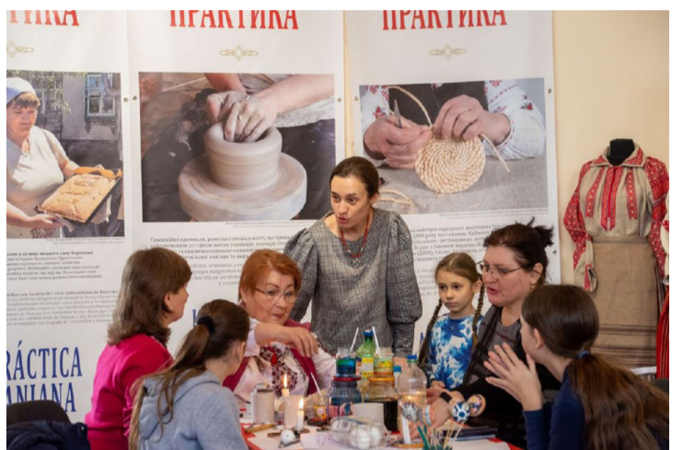
Майстер-клас з писанкарства проходив у рамках міжнародної виставки

однією з опор політики з охорони нематеріальної культурної спадщини Колумбії та усїєї Латинської Америки. В її серцевину покладена стратегія «Культурний інструментарій миру».