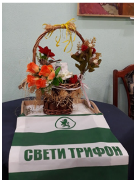
Фрагмент інтер'єру, ВЦБК