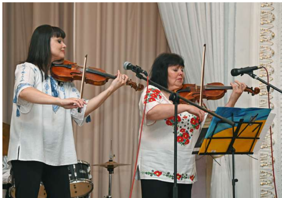
Звучить чудова музика.

Підсумовуючи свої враження від події, її організа-