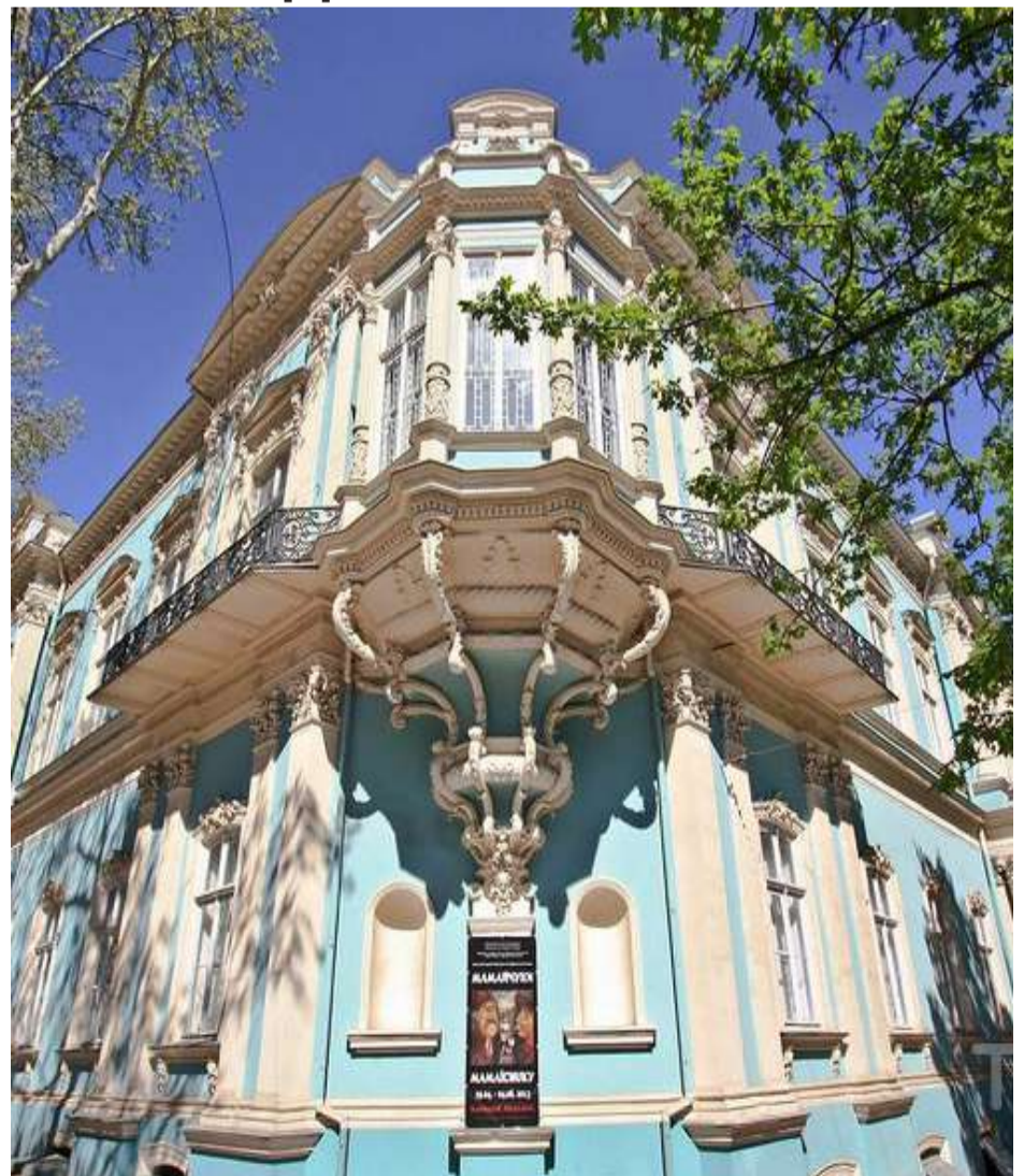
ОДЕСЬКОМУ МУЗЕЮ ЗАХІДНОГО І СХІДНОГО МИСТЕЦТВА - 100 РОКІВ