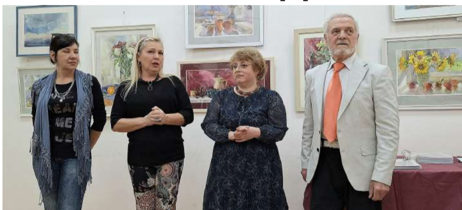
Хвилююча мить відкриття виставки.