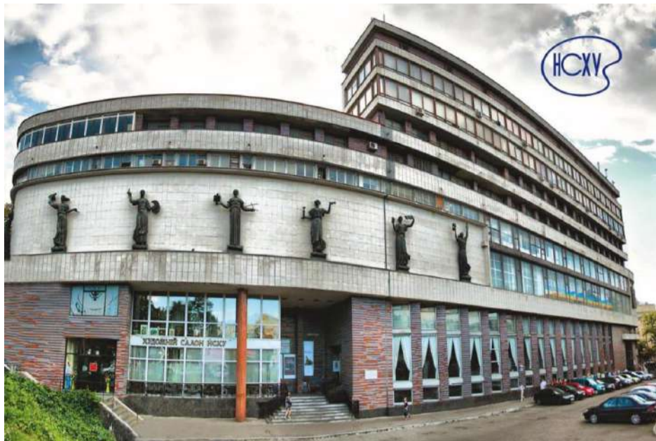
Центральний будинок художника Національної спілки художників України (м. Київ).