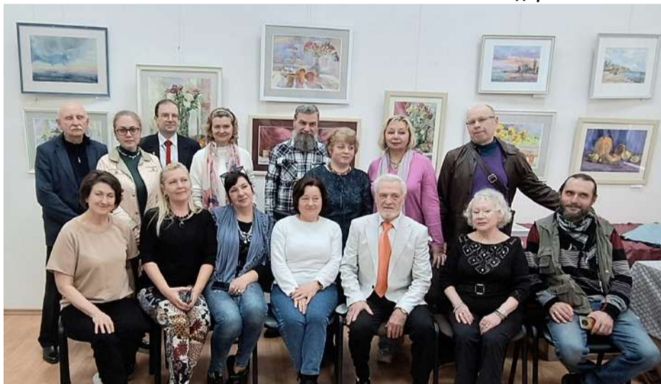
Спільне фото на добру пам'ять про важливу подію у мистецькому житті. 02.04.2024 р.