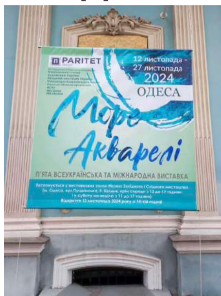
Афіша виставки на тлі фасаду старовинного палацу – будівлі Одеського музею західного і східного мистецтва.

12 листопада 2024 р. у залах Одеського музею західного і східного мистецтва (на другому поверсі) відбулося урочисте відкриття П'ятої Всеукраїнської та Міжнародної виставки-бієнале «Море акварелі». Вже вдруге ця виставка