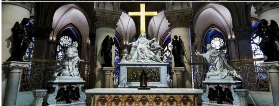
Інтер'єр Собору до і після реставрації.

багатьма у світі як погане передвістя. Тоді зайнялися будівельні риштування на даху Собору. Точну причину пожежі встановити не вдалося, проте версію навмисного підпалу слідство виключило. Дах собору вигорів повністю, шпиль був зруйнований. Пошкодження всередині будівлі були набагато меншими. У роботах з реставрації Собору брали участь 250 будівельних компаній і сотні фахівців. Деревину дубу, яку використовували при реставрації, збирали по всій країні. Понад 1000 артефактів знайшли археологи під Собором Нотр-Дам де Парі за роки реставрації.