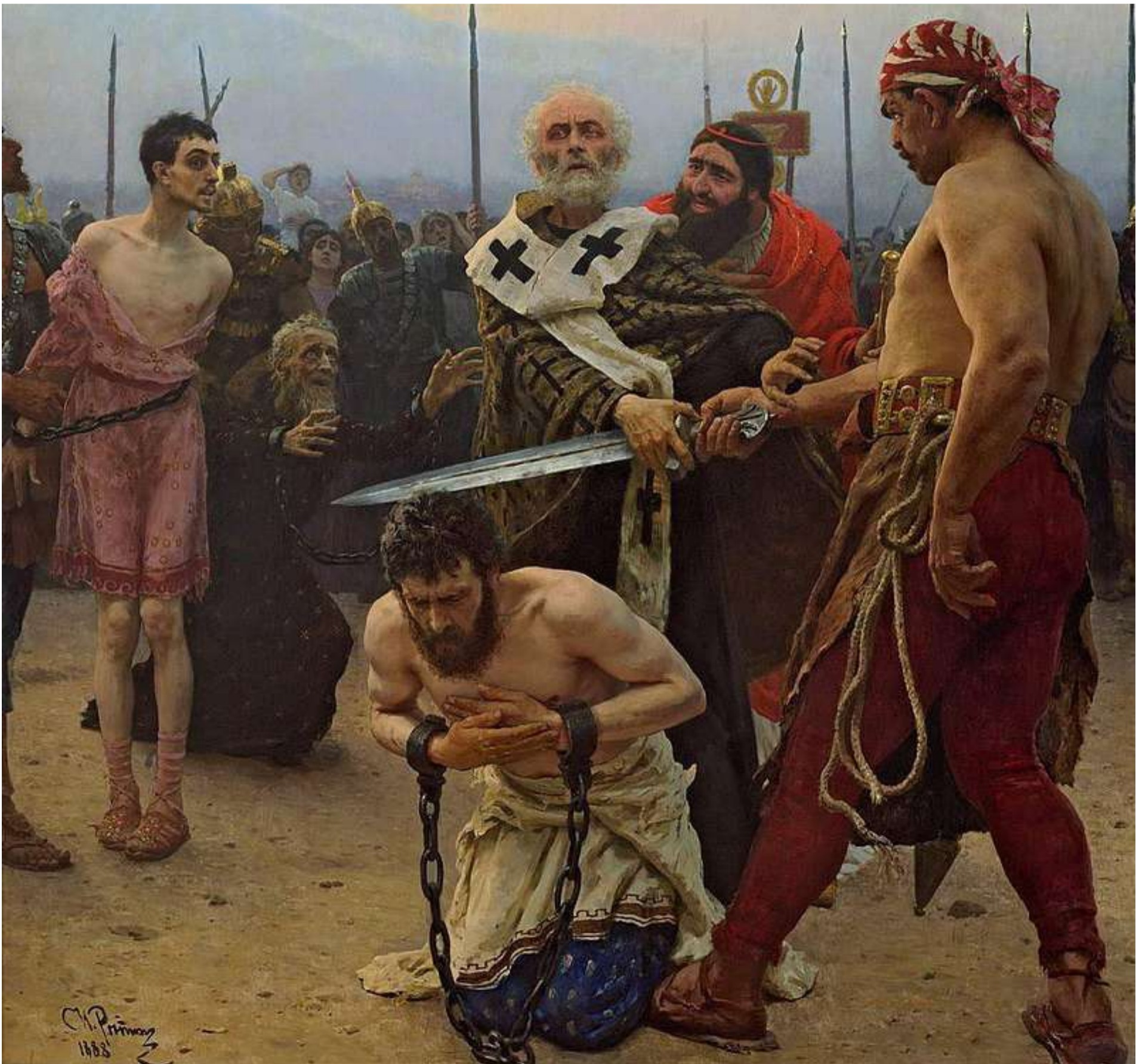
Ілля РЕПІН (1844-1930) "Миколай Мирлікійський рятує від смертної кари трьох невинно засуджених" 1888 р. Полотно, олія. 215 x 196 см.