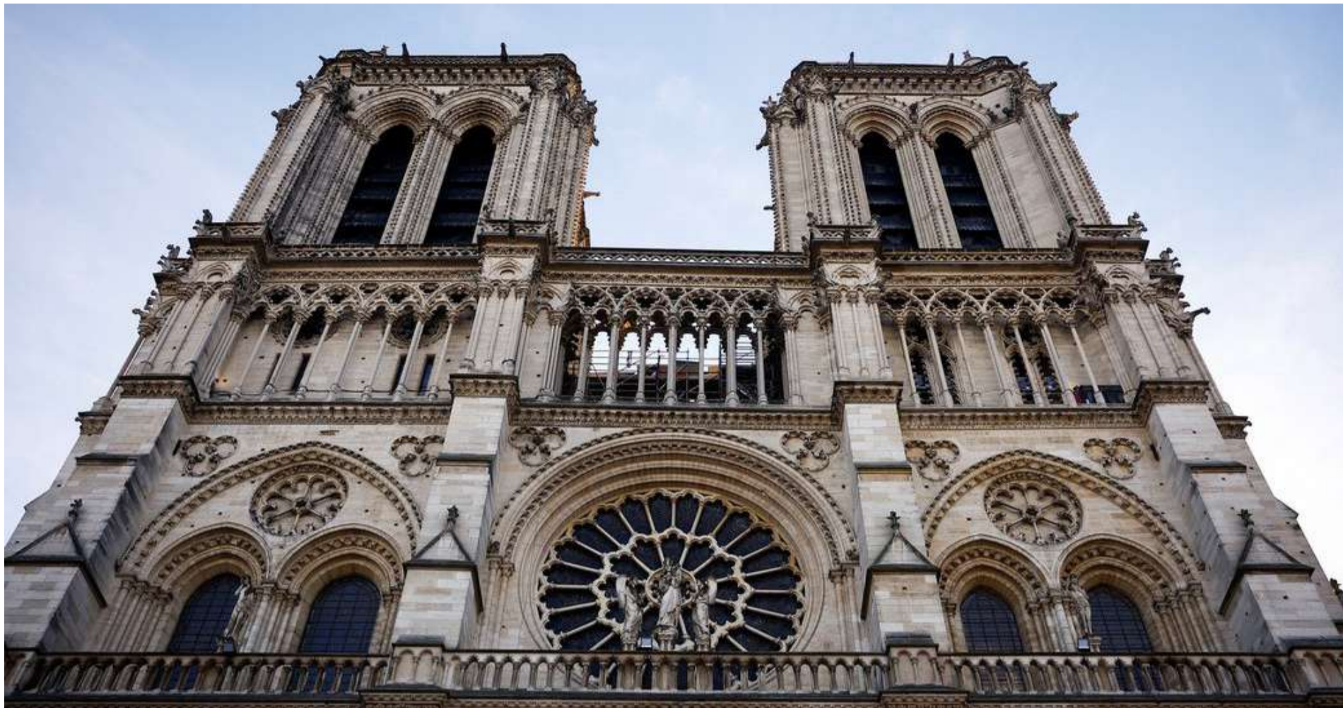
Фасад відреставрованого Собору Нотр-Дам де Парі.

7 грудня 2024 р. відбулася урочиста церемонія відкриття відреставрованого Собору Паризької Богоматері (Нотр-Дам де Парі). Ця церемонія відбулася через п'ять з половиною років після пожежі, яка значно пошкодила історичну будівлю - пам'ятку культури, історії та архітектури світового значення.