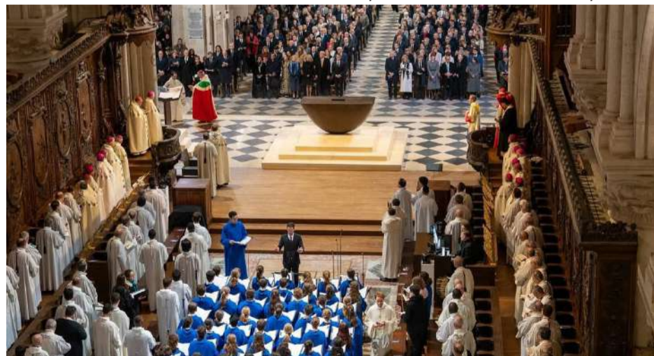
Урочиста церемонія відкриття Собору після реставрації.

але ми вибрали початок, волю, курс надії, поставивши собі за мету відновити Нотр-Дам де Парі ще красивішим за п'ять років». В своїй промові президент Франції наголосив на «братстві тих, хто пожертвував кошти на всіх континентах, представників усіх релі-