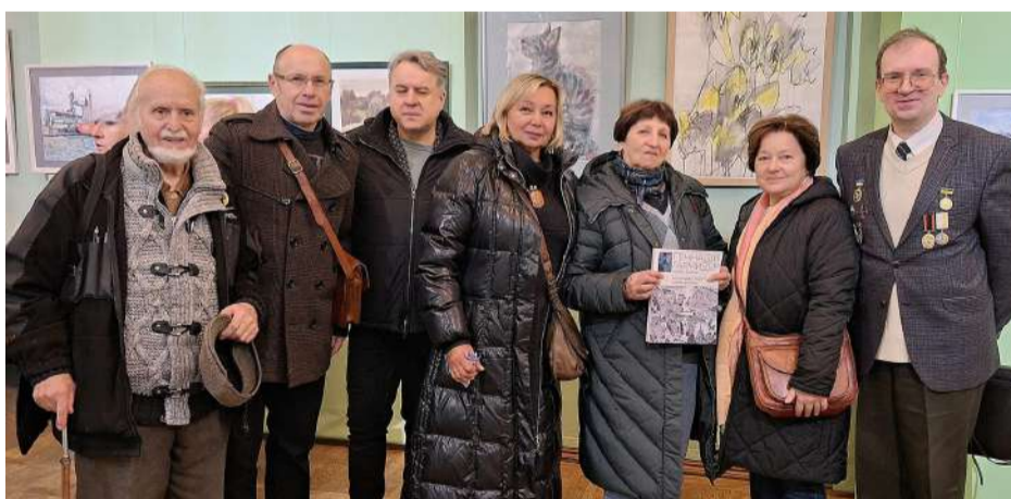
Учасники виставки-бієнале радіють її відкриттю 12 листопада 2024 р.

12 листопада 2024 р. у залах Одеського музею західного і східного мистецтва (на другому поверсі) відбулося урочисте відкриття П'ятої Всеукраїнської та Міжнародної виставки-бієнале «Море акварелі». Вже вдруге ця виставка