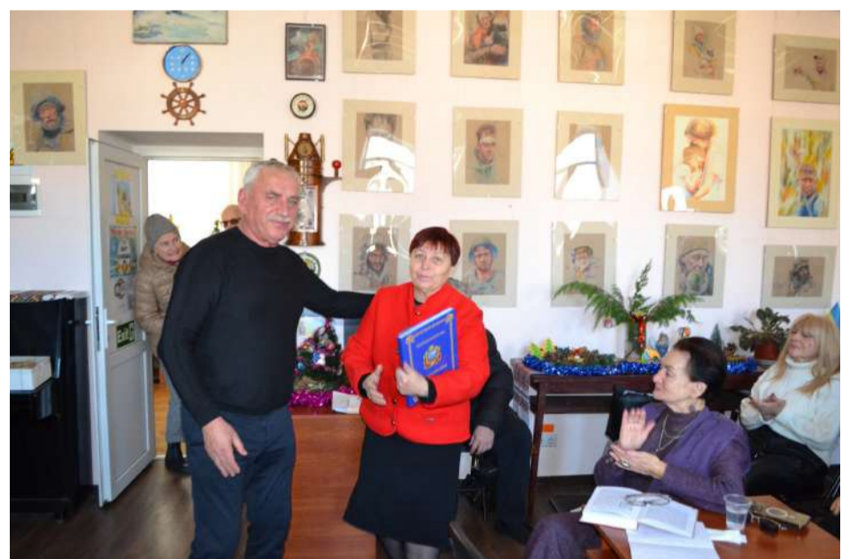
Міський голова м. Чорноморськ В. О. Гуляєв привітав авторку-упорядницю «Книги пам'яті» і подарував книгу про місто, яке очолює.