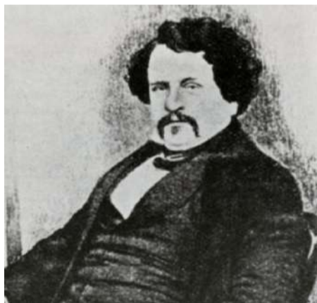
Джозеф Аспдін (Joseph Aspdin) (25.12.1778-20.03.1855).

У 1817 р. він заснував власний бізнес у центрі Лідсу. Джозеф Аспдін експериментував з виробництвом цементу протягом декількох років. 21 жовтня 1824 р. йому був виданий британський патент ВР 5022 під назвою: «Вдосконалення способу виробництва штучного каменю», в якому був введений термін «портландцемент» (за аналогією з натуральним портландським каменем). Цей винахід мав всесвітнє значення. Портландцемент застосовується у всьому світі.