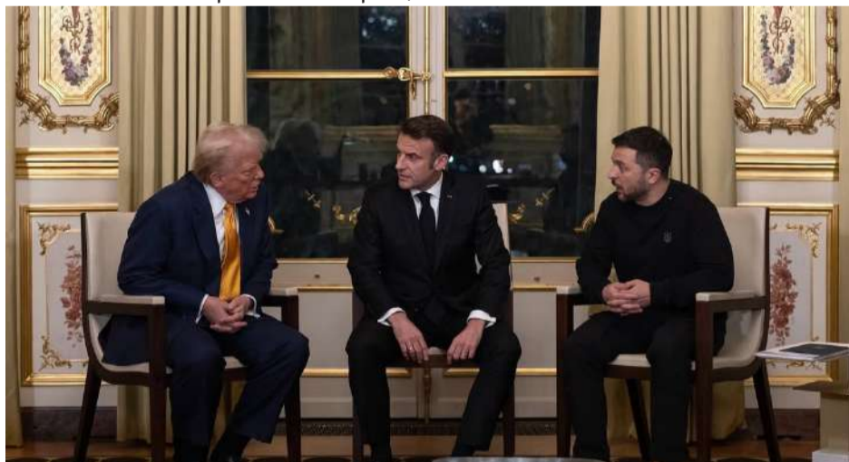
Зустріч трьох президентів в столиці Франції: обраного президента США Дональда Трампа, президента Франції Еммануеля Макрона і президента України Володимир Зеленського.

Відкриття Собору Нотр-Дам де Парі після масштабної рестав-