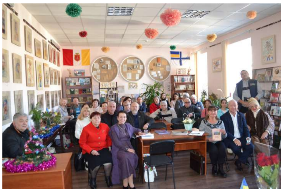
Учасники презентації – світлина на добру пам'ять про важливу подію.

Присутні з теплотою і вдячністю згадували незабутніх вчителів і наставників, імена яких золотими літерами вписані в історію Одеської державної академії будівництва та архітектури.