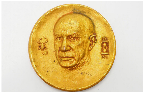
Пам'ятна медаль музею Пабло Пікассо в Барселоні із зображенням лица всесвітньовідомого художника.

Міжнародний день художника (International Artist's Day) відзначається 25 жовтня.