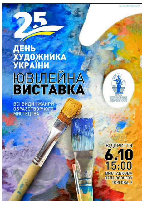
Афіша Ювілейної виставки.

Цьогоріч святкування професійного свята митців – Дня художника України став особливим. Адже ж відзначається вже у 25-те. Крім того, у цьому році виповнилося 85 років від дня створення Національної спілки художників України. Саме цим знаменним датам була присвячена виставка найкращих творів митців Одещини, відкриття якої відбулося в урочистій обстановці 6 жовтня 2023 р. у виставковій залі Одеської обласної організації Національної спілки художників України (вул. Торгова, 2). Активну участь у виставці взяли співробітники нашої Академії – викладачі кафедр образотворчого мистецтва, рисунка, живопису та архітектурної графіки Архітектурно-художнього інституту. На урочистому відкритті багатьох з них було нагороджено Вітальними листами Національної спілки художників України та Грамотами Одеської обласної організації НСХУ «за активну та плідну творчу працю, особистий вагомий внесок