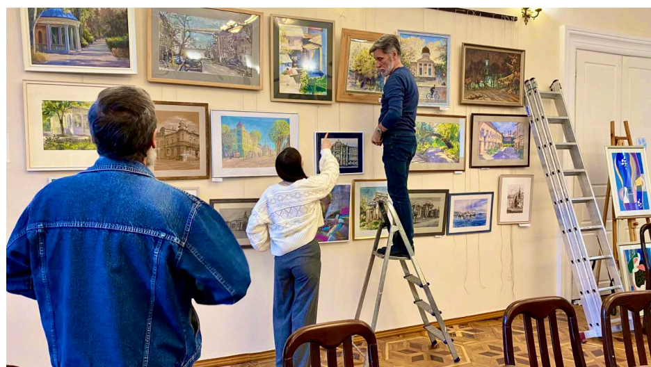
Монтаж виставки.