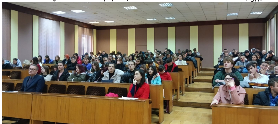
Зацікавлена аудиторія студентської конференції.