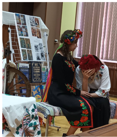
Сторінки літературних творів оживають у виконанні наших студентів.