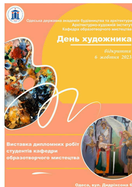
Афіша виставки дипломних робіт студентів кафедри образотворчого мистецтва, присвячена Дню художника.