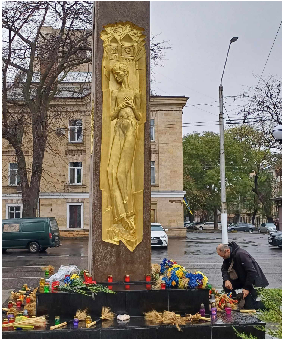
Пам'ятний знак жертвам Голодомору на Лідерсівському бульварі в Одесі 25 листопада 2023 р.

Щороку в четверту суботу листопада Україна вшановує пам'ять жертв Голодомору 1932-1933 років і штучних голодів 1921-1923 і 1946-1947 років.