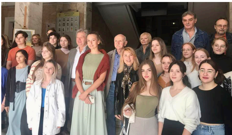
Світлина на добру пам'ять про відкриття виставки.