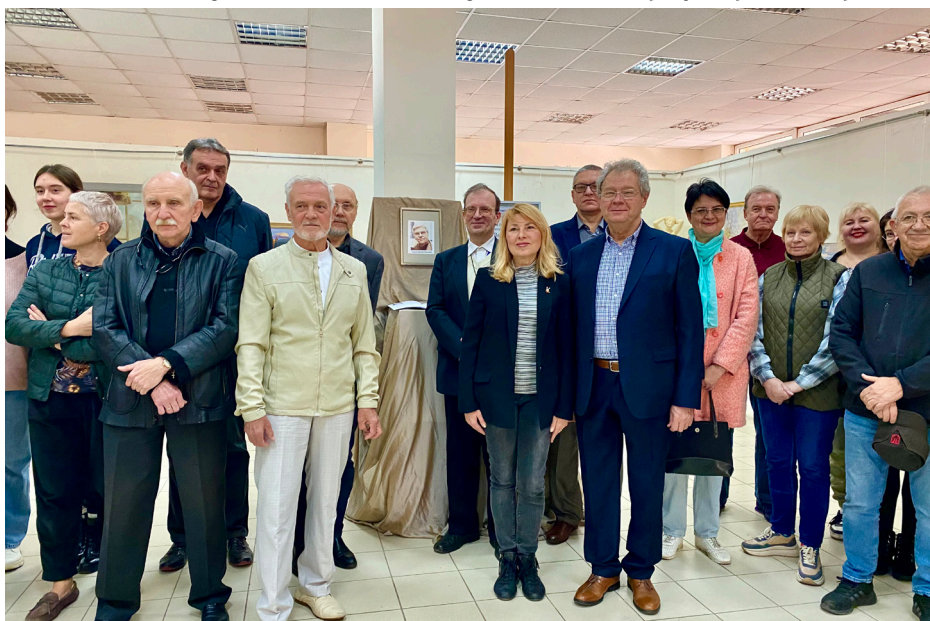
Ми пам'ятаємо. Наш смуток – світлий, а пам'ять – вдячна.

запросив найкращих художників-педагогів викладати на новій кафедрі. Сьогодні вже можна сміливо сказати, що становлення художньої освіти в Одеській державній академії будівництва та архітектури відбулося. Про це свідчать і грандіозні звітні виставки дипломних робіт її студентів, і успіхи її випускників в Україні і далеко за її межами.