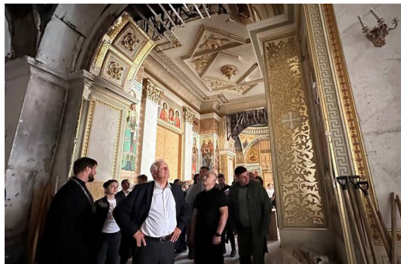
Жозеп Боррель в пошкодженому Спасо-Преображенському кафедральному соборі.

Пан Боррель підкреслив, що його візит до Одеси – демонстрація під-