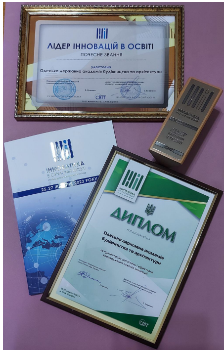
Нагороди, які отримала наша Академія на XV Міжнародній виставці «Інноватика в сучасній освіті».

25-27 жовтня 2023 року відбулася XV Міжнародна виставка «Інноватика в сучасній освіті».