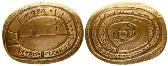
Найвища нагорода ЮНЕСКО у галузі мистецтва – Медаль ім. Пабло Пікассо.