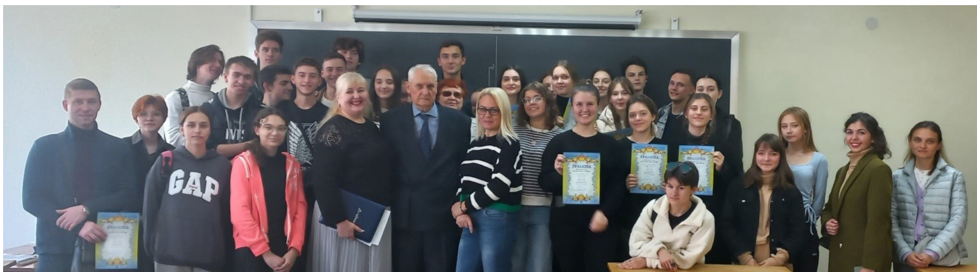
Пам'ятна світлина, що поєднала організаторів і учасників XXXVI олімпіади з нарисної геометрії в ОДАБА.

Міські олімпіади з нарисної геометрії в Одесі мають давню традицію. У цьому році 26 жовтня в Одеській державній академії будівництва та архітектури проводилась вже XXXVI олімпіада, присвячена пам'яті Заслуженого архітектора України, засновника Архітектурно-художнього інституту професора Валерія Павловича Уреньова. Традиційно в олімпіаді беруть участь не лише студенти ОДАБА, але й студенти з інших міст та з інших навчальних закладів Одеси. Але, умови сьогодення дозволили провести олімпіаду серед студентів ОДАБА. Кількість учасників досить значна – 84, що дозволило провести змагання на досить високому рівні,