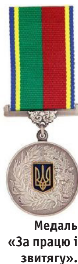
Медаль «За працю і звитягу».

Серед її нагород: Почесна Відзнака ОДАБА (2010), Пам'ятна Відзнака ОДАБА (2005), Почесна Грамота ОДАБА (2015), Почесна Грамота Департаменту освіти і науки Одеської обласної держав-