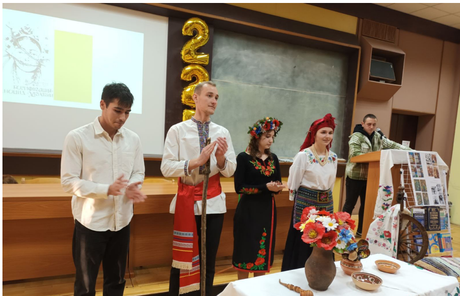
Активні учасники конференції.

«Життєвий та творчий шлях Осипа Тадейовича Назарука (до 140-ї річниці від дня народження)»; Васильєва Вікторія та Демус Катерина «Українські пісні — душа українського народу»; студенти Інженерно-будівельного інститу-