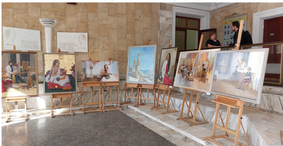
Експозиція виставки дипломних робіт студентів кафедри образотворчого мистецтва в головному корпусі ОДАБА.